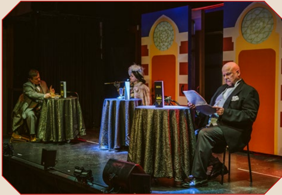
"Tätä tietä, monsieur. Minulla on teille erinomainen pöytä varattuna."